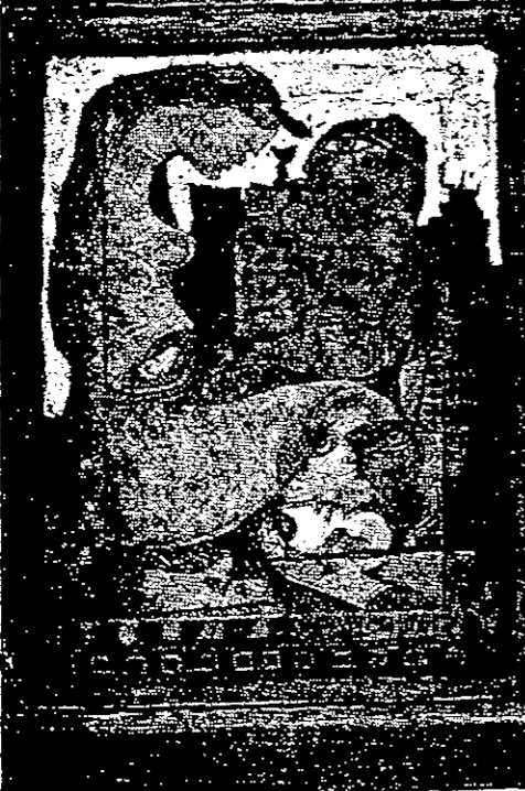
لوحة للفنان (القدس العربي)

تونس - القدس العربي بالمعهد طلب حجب اسمه، فان وزارة التعليم اتتصلت من المسؤولية وتبعث بها نحو وزارة الثقافة التي بدورها تنتقل منها وتعيد الطالب نحو وزارة التعليم وهكذا وبذلك.. وتقول إحدى الطالبات ما معناها: «يوافق والذي على ان اتعلم المسرح وهو شيء غير مرغوب فيه اجتماعياً ويتكف بصاريف الدراسة والأقامة والإيسار في تونس العاصمة.. وبعد أربع سنوات، وبعد التخرج، أجد نفسي عاطلة عن العمل اجبارياً وقانونياً.. فلا هذه الوزارة تعترف بشهادتي ولا تلك كذا..» وما تقول هذه الطالبة يمكن ان ينطبق على جل طلبة المعهد وهم يناهزون 120 طالباً معظمهم من داخل الجمهورية، وتخرج منهم سنوياً حوالي 20 طالباً لا يمكن لم يتمكن من بينهم منذ أكثر من سبع سنوات أكثر من عشرة طلاب في الحصول على شغل في ميدان دراستهم.